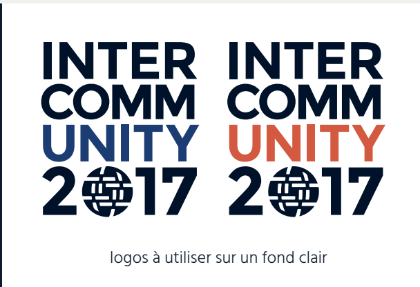
logos à utiliser sur un fond clair

Cliquez sur ce lien pour télécharger tous les fichiers : https://www.internetsociety.org/intercommunity/2017/celebrate/download