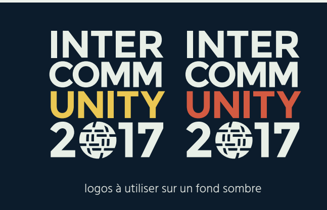
logos à utiliser sur un fond sombre